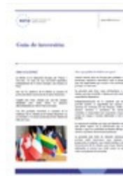
Guía de inversión para inversores minoristas (Pincha sobre la imagen para descargar)